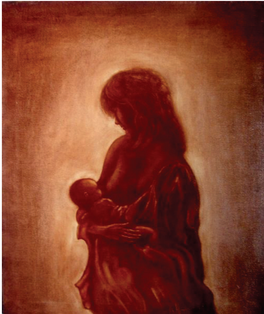
MAZZACANI GIANCARLO mamma con bambino 2